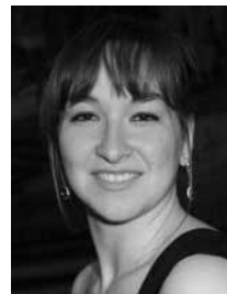
Giada Frasconi contralto