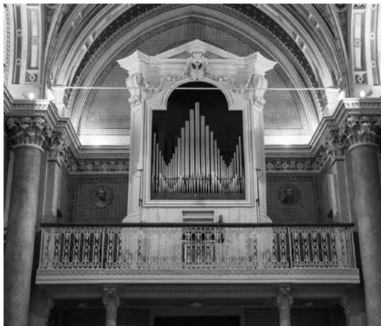
Organo A. Rossi (1791) Chiesa di San Bartolomeo Solomeo